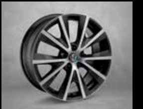
7HP 225/40 R18" Çift Kollu Koyu Renk Hafif Alaşım Jantlar (Super ops)