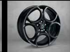
5FB 225/40 R18" Koyu Renkli Sportif Hafif Alaşım Jantlar (Super ops)