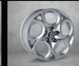
5YN 225/45 R17" Sportif Hafif Alaşım Jantlar (Super std)