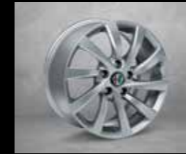
431 205/55 16" Türbin Hafif Alaşım Jantlar (Progression std)