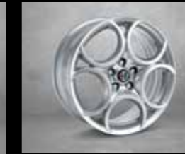
439 225/40 R18" Sportif Hafif Alaşım Jantlar (Super ops)